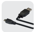
USBY-01 micro USB cable 傳輸線