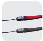
LY-01R / LY-01B 吊帶