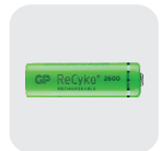
RB-2600 可充式"AA" Ni-MH 電池