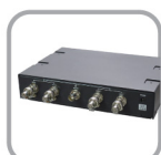
ACR 4 天線整合器